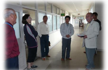
備蓄倉庫の検討風景。(右)