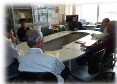
避難所の備蓄に関する検討会議。(5/12)